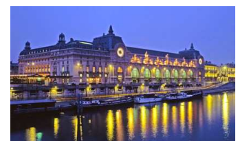
Le Musée d'Orsay

Quel est son titre ? L'invention de Paris