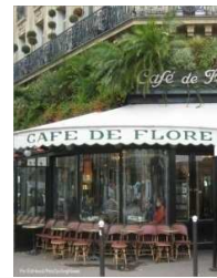
Le café de Flore

Quel est le titre de la revue ? Pouvez-vous emprunter ce document ? Oui, sauf s'il s'agit du dernier numéro